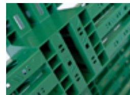
Bază palet A4L