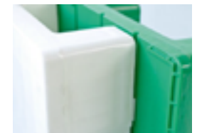
Cu sau fără siguranță împotriva alunecării

EUROPLAST ROMANIA SRL 410169 Oradea/ Bihor/ Romania