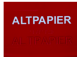
Ștanțare la cald

EUROPLAST ROMANIA SRL 410169 Oradea/ Bihor/ Romania