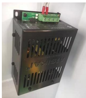
ATS 100A disponibil pentru Auto-Start