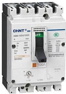
2 x 12v acumulator Dry 60A cu intrerupator General