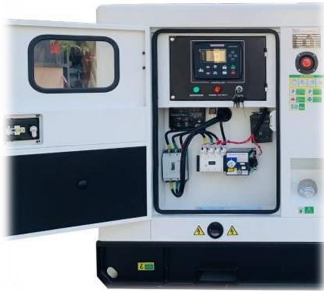
CHNIT MCCB siguranta tripolara 3P