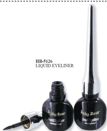
HB-5126 LIQUID EYELINER