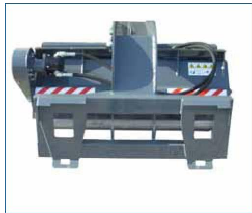
attacco rapido universale a norme DIN