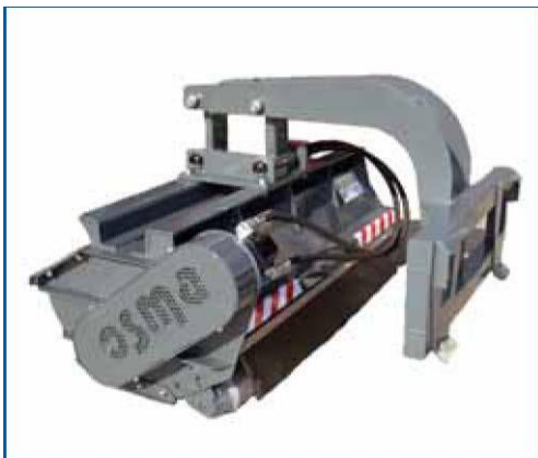
Sospensione autolivellante (eccetto forestali ux)