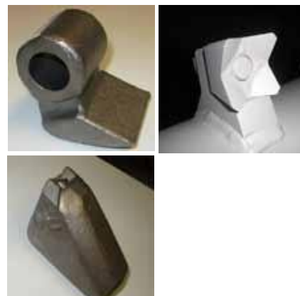
a = utensile HD b = utensile Q c = utensile UX