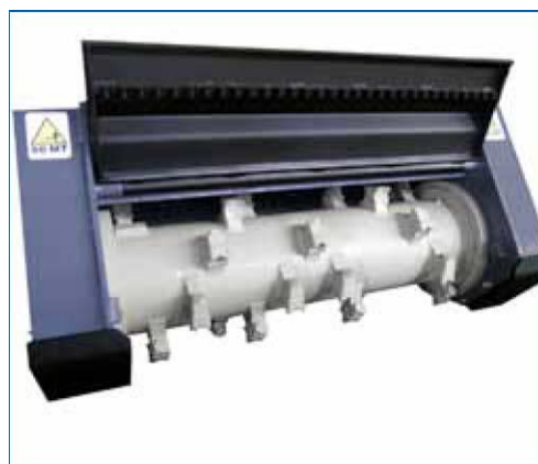
Rotori con utensili reversibili Q