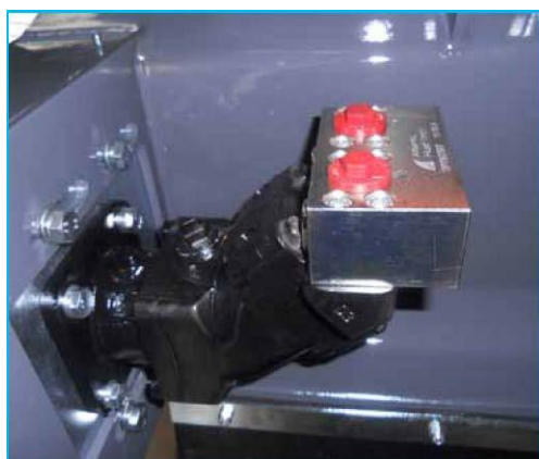
Valvola anticavitazione integrata nel motore