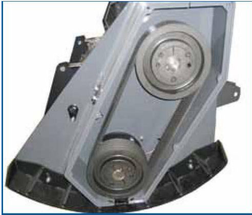
Trasmissione a cinghie trapezoidali