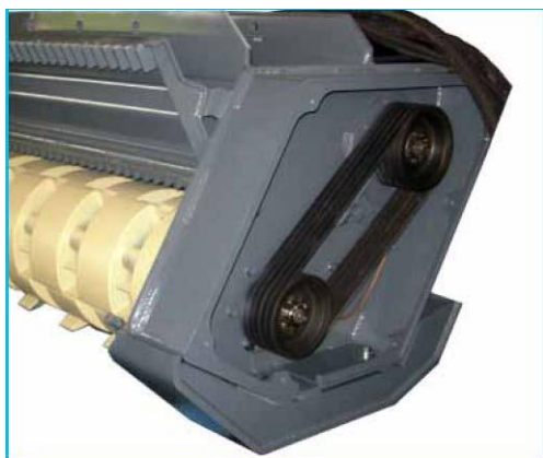
Trasmissione a cinghie trapezoidali