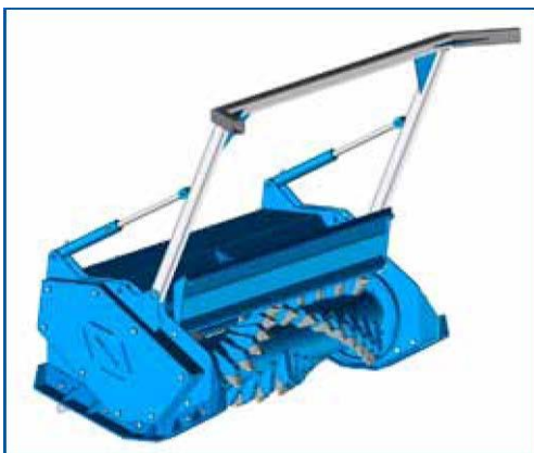
Progettazione in 3D e analisi FEM