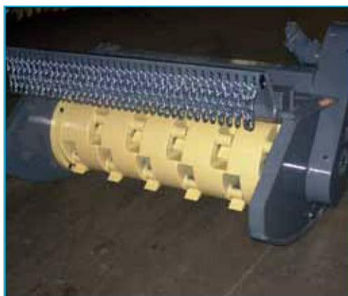
Rotore utensili mobili HD