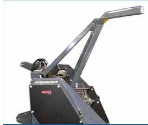
Abbattirami (opz.idraulico) - serie UX